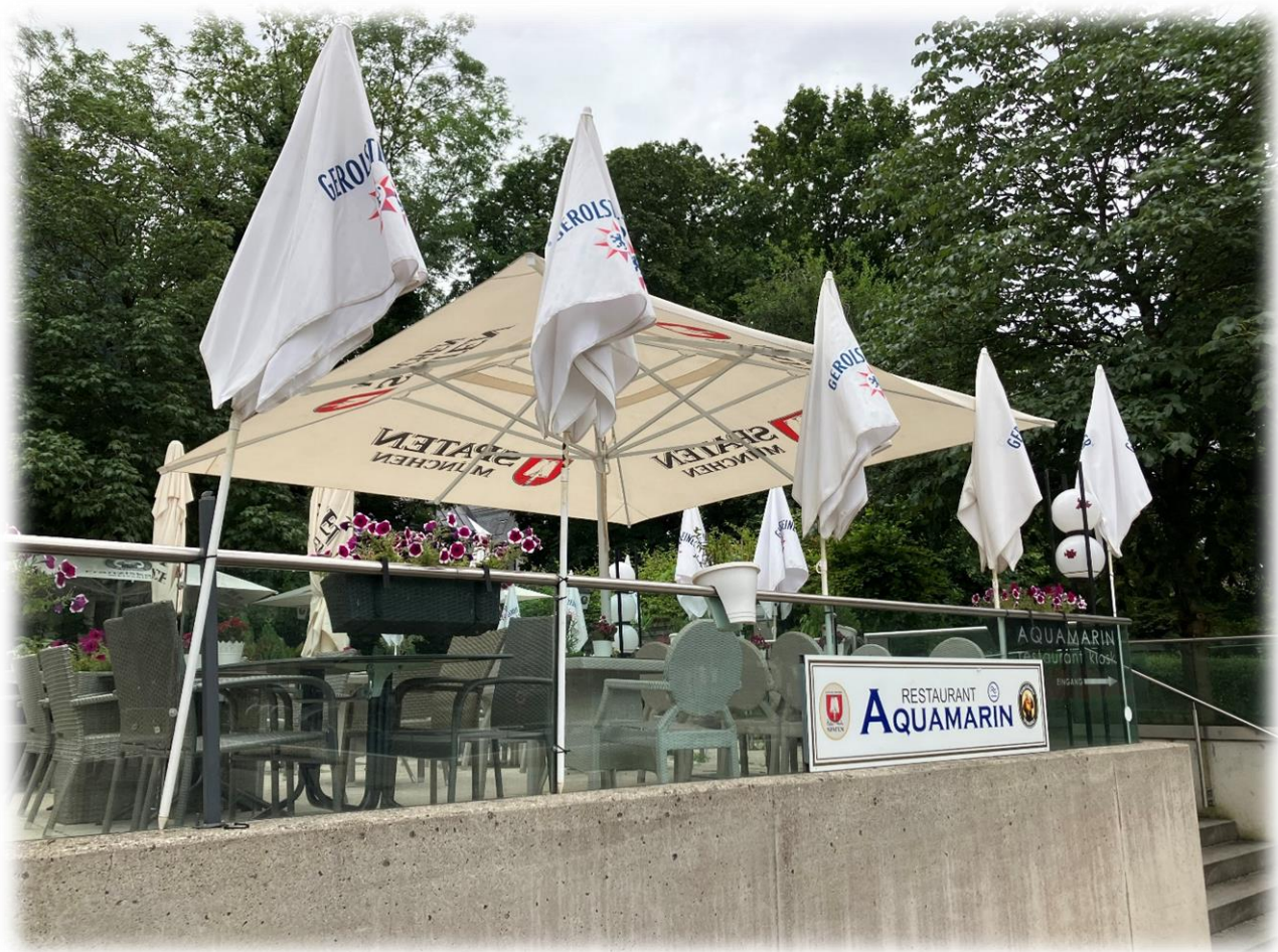
Biergarten innerhalb des Bades

Bogenhausen grenzt (im Uhrzeigersinn aufgezählt) an die Münchner Stadtbezirke Trudering-Riem im Südosten, Berg am Laim und Au-Haidhausen im Süden sowie Altstadt-Lehel und Schwabing-Freimann im Westen jenseits der Isar. Außerdem grenzt der Bezirk an die Gemeinden Unterföhring im Norden und Aschheim im Nordosten.